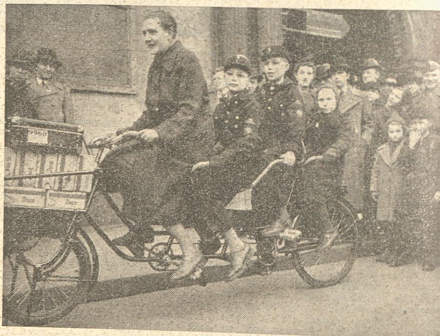
Denna praktiska tandemcykel för barnrika familjer säljes på Leipzigmässan. Det ökade utrymmet har vunnits genom påmonterande av ett par extra sadlar.